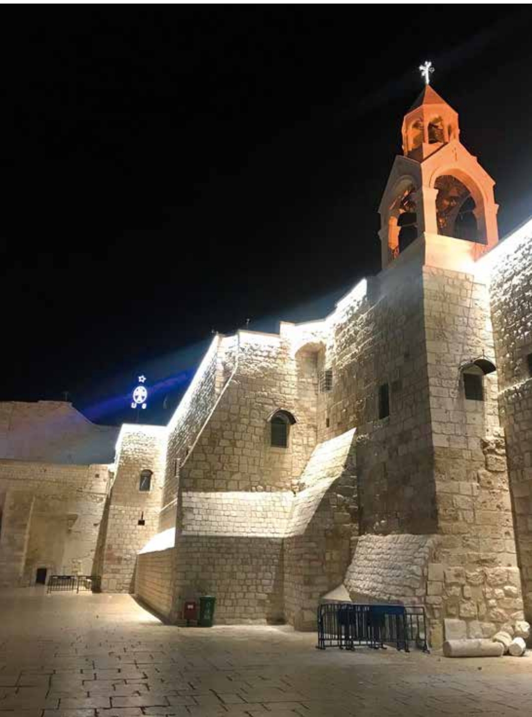
Betlemme, la piazza della Natività senza pellegrini